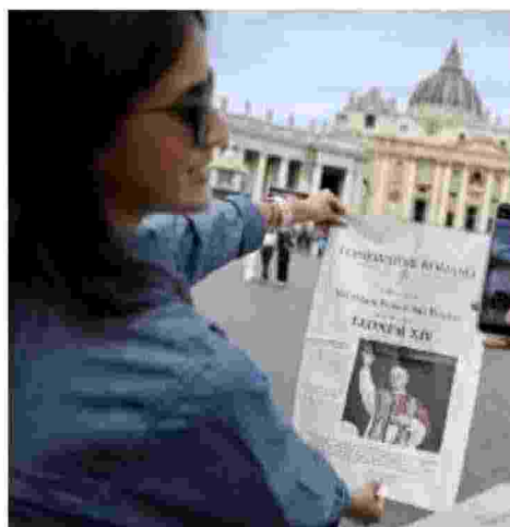
Il Papa in prima pagina il 9 maggio 2025

Robert Francis Prevost è stato eletto Papa al quarto scrutinio del conclave. È il primo pontefice nordamericano della storia e il primo appartenente all'Ordine degli Agostiniani