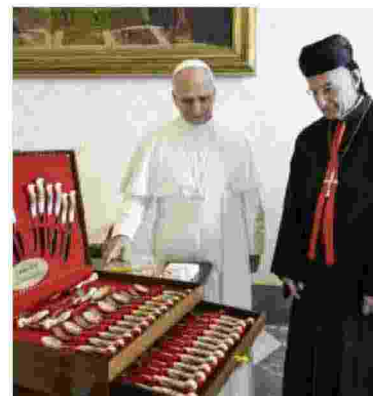
L'incontro con il patriarca di Antiochia

Ritaglio stampa ad uso esclusivo del destinatario, non riproducibile.