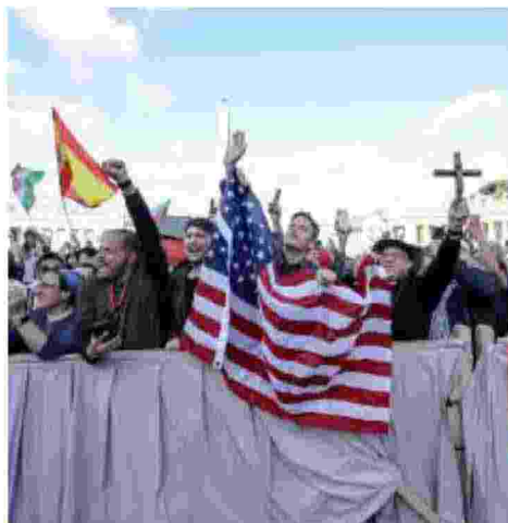
L'entusiasmo di alcuni fedeli americani