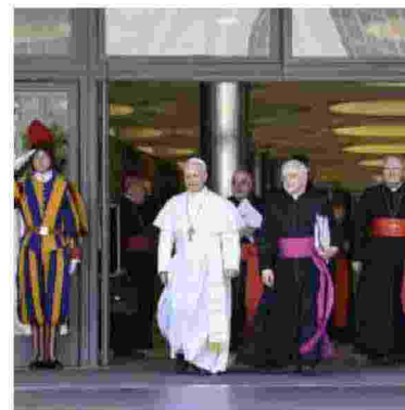
Papa Leone a un meeting con i cardinali