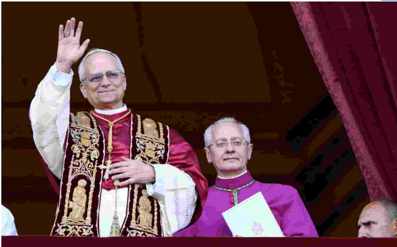
Il giorno dell'elezione Papa Leone XIV si affaccia dal balcone della basilica di San Pietro e saluta i fedeli dopo la sua elezione l'8 maggio 2025

Ritaglio stampa ad uso esclusivo del destinatario, non riproducibile.