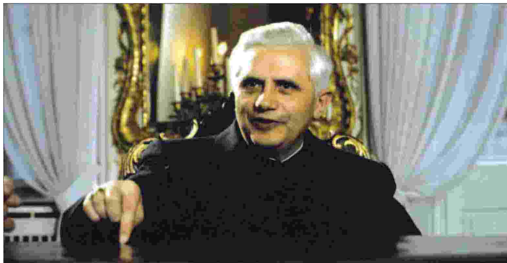
Joseph Ratzinger era stato perito al Concilio al seguito del cardinale arcivescovo di Colonia, Josef Frings, tra i leader della corrente riformista

Lo sguardo retrospettivo non permette predizioni del futuro, ma limita l'illusione dell'assoluta straordinarietà