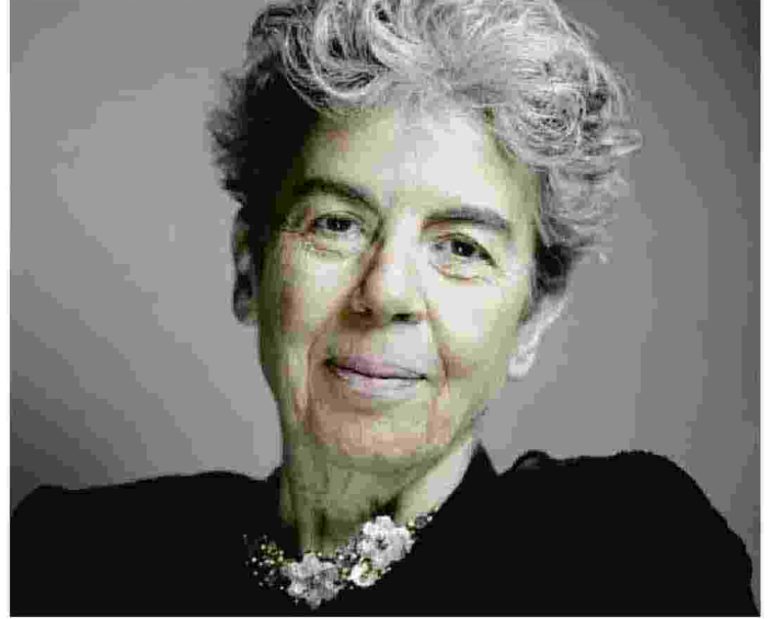
TRANSALPINI Dall'alto, in senso orario: Chantal Delsol, Pascal Bruckner e Alain Finkelkraut