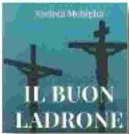
ANDREA MOBIGLIA "Il buon ladrone" Cantagalli Editore, 10 euro

Ammalato e costretto a letto a causa della leucemia, il dottor Takashi Nagai, detto "il santo di Urakami", rievoca i momenti intimi della propria famiglia, la guerra, le difficoltà e la nascita dei figli. Soprattutto, ricorda quel giorno dell'agosto 1945 quando la cattedrale e il quartiere cattolico di Nagasaki furono ridotti in macerie dall'esplosione della bomba atomica. Per Nagai la tragedia significò la morte della moglie, accanto alla quale fu trovato fuso un pezzo