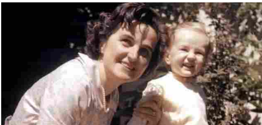
Santa Gianna Beretta Molla (1922-1962)