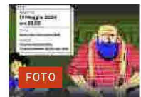
FOTO "Investire in educazione". Incontro sulla mostra "Alleanza scuola lavoro"