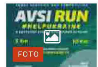
FOTO Avsi Run al Parco di Monza per sostenere i progetti dell'ong in

Ritaglio stampa ad uso esclusivo del destinatario, non riproducibile.