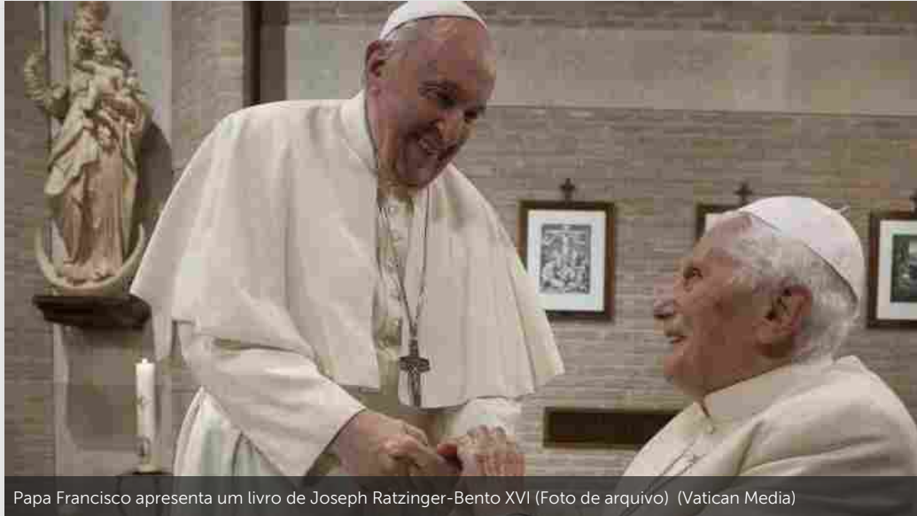
Papa Francisco apresenta um livro de Joseph Ratzinger-Bento XVI (Foto de arquivo) (Vatican Media)

PAPA PAPA FRANCISCO PAPA BENTO XVI EUROPA TUTELA DA VIDA LIVRO