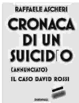
La cover del libro

cupato per la moglie che aveva problemi di salute. (...) Ha manifestato una situazione di ansia derivante dalla perquisizione da lui subita in un contesto già problematico: disse che questa cosa per lui rappresentava un dramma; disse che era