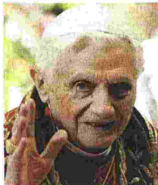
EMERITO Joseph Ratzinger