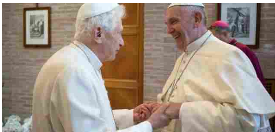
Ratzinger e Papa Francesco